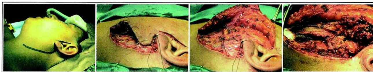
FIGURA 5: DISTINTAS SECUENCIAS DE LA CIRUGÍA REALIZADA EN NUESTRA PACIENTE.

Los paragangliomas en general y los derivados del vago en particular (alrededor de 300 casos publicados) son tumores raros 4,5,6 .