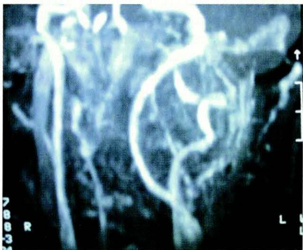
FIGURAS 3 Y 4: IMÁGENES DE RMN Y ANGIORMN. NÓTESE EL DESPLAZAMIENTO CAROTÍDEO PROVOCADO POR EL TUMOR.

En el postoperatorio inmediato constatamos una paresia facial izquierda, parálisis del hipogloso y del nervio espinal homolateral, aparte de la recurrental que ya presentaba previamente.