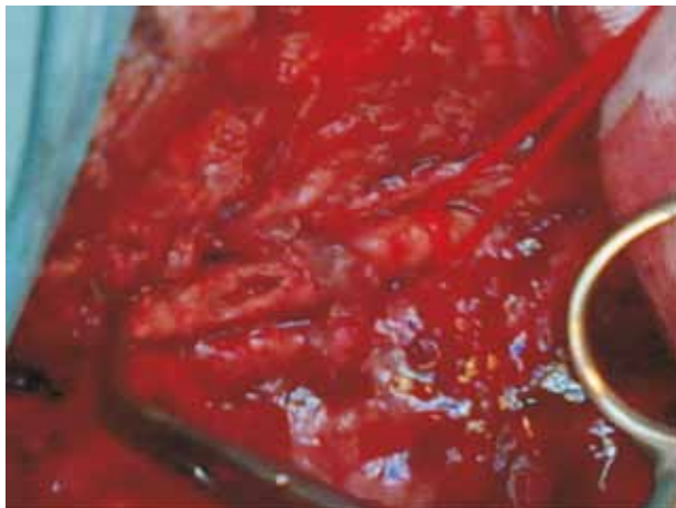
FIGURA 4 Solução de continuidade na parede da carótida primitiva

No pós-operatório imediato e à data da alta o doente manteve os sinais vitais e status neurológico normalizado.