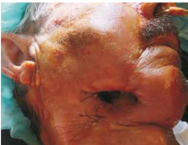
FIGURA 1 Fístula orocervical

Após excluída a hipótese de recidiva local e metastização à distância, foi efetuada, limpeza cirúrgica cervical com reconstrução de defeito ósseo mandibular e fístula orocervical