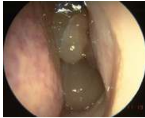
Fig.2 Obstrução nasal causada por polipos.

Nos Estados Unidos da América a rinite alérgica é a segunda doença crónica mais frequente 2 com metade dos doentes a referir sintomas da doença durante mais de 10 anos, assistindo-se actualmente ao aumento da prevalência da atopia nos adultos de meia idade, criando-se o conceito de "geração alérgica" 3