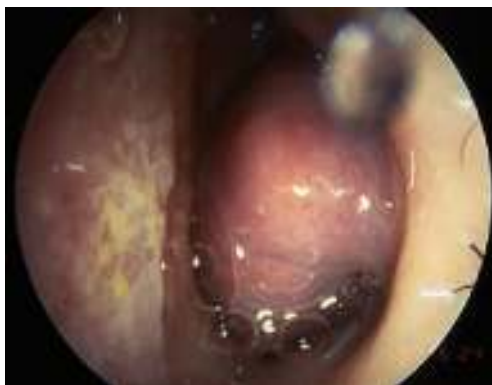
Fig.1 Congestão nasal com edema do corneto inferior esquerdo num doente com rinite alérgica.

A congestão nasal é um termo que traduz habitualmente a obstrução nasal relacionada com edema da mucosa nasal, causado pela dilatação dos capilares, com consequente aumento de permeabilidade e exsudação de plasma para a sub-mucosa 1 . É o sintoma mais referido nas doenças inflamatórias e/ou infecciosas da mucosa nasal, sendo a rinite alérgica a sua causa mais frequente (fig.1). Outras doenças que cursam com congestão nasal são a rinosinusite aguda de etiologia viral (coriza) ou bacteriana, as rinites químicas, medicamentosas ou endócrinas, a polipose naso-sinusal (fig.2) e, mais raramente, a patologia auto-imune ou a granulomatosa.